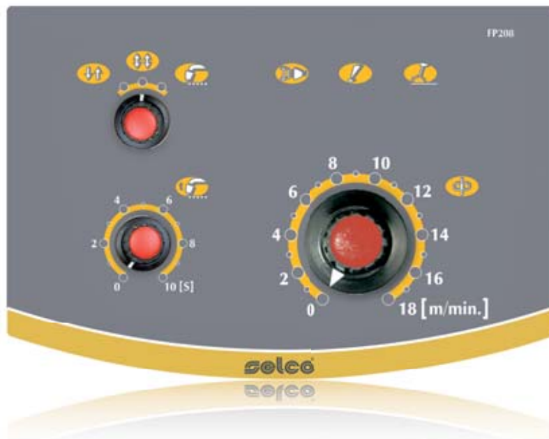
wf 115 xp